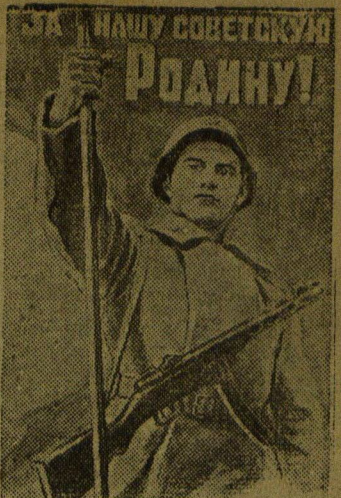
Плакат работы худ. И. Тоидзе, выпущенный издательством «Искусство».